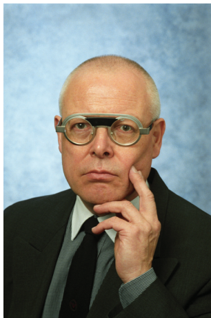
Prof. Albrecht Goeschel

Geht man davon aus, dass Ehescheidungen für die betroffenen Männer eine negative Gesundheitswirkung haben, dann muss die gesundheitliche Lage von Männern in Regionen mit hohen Scheidungshäufigkeiten ungünstiger sein als in Regionen mit niedrigen Scheidungshäufigkeiten. Wegen des funktionalen Zusammenhanges der gesundheitlichen Negativwirkungen von Scheidungen auf Männer und den gesundheitlichen Positivwirkungen von Eheschließungen auf Männer hängt dabei die unterschiedliche gesundheitliche Lage in Regionen mit unterschiedlichen Scheidungshäufigkeiten auch noch davon ab, ob in den jeweiligen Regionen gleichzeitig hohe oder niedrige Eheschließungshäufigkeiten zu verzeichnen sind. ...“